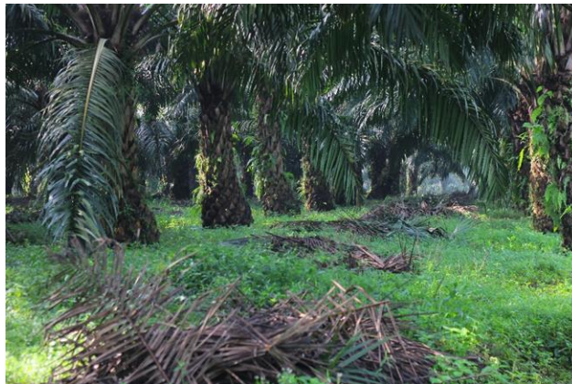
Gambar 2. Kondisi Pasar Pikul.

Pada Gambar 2 terlihat bahwasannya kondisi pasar pikul tidak terawat karena pemanen yang asal dalam menaruh pelepah begitu saja tidak di susun di gawangan mati, sehingga pemanen di lahan untuk proses penurunan buah pemanen sendiri berjalan di bawah pokok sawit tidak