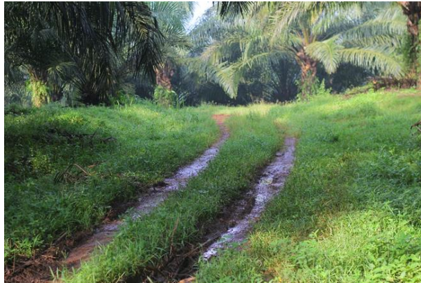
Gambar 4. Kondisi Collection Road

Kondisi Collection Road atau jalan pengangkutan buah di tempat saya penelitian banyak yang tertutupi oleh pelepah karena penentuan jalan tidak sesuai SOP sehingga keadaan seperti ini membuat jalan sulit untuk mongering sehingga ketika hujan datang menyebabkan terjadinya genangan air sehingga kondisi jalan menjadi lembek hal ini menyebabkan terkendalanya