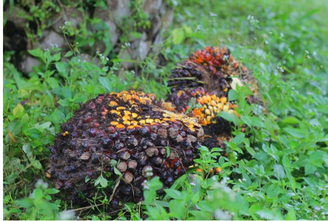
Gambar 1. Kondisi buah di piringan

Dapat dilihat pada gambar 1 bahwa kondisi lahan tidak terawat karena kondisi gulma yang tumbuh tidak terurus sehingga keadaan ini menyebabkan sulitnya dalam