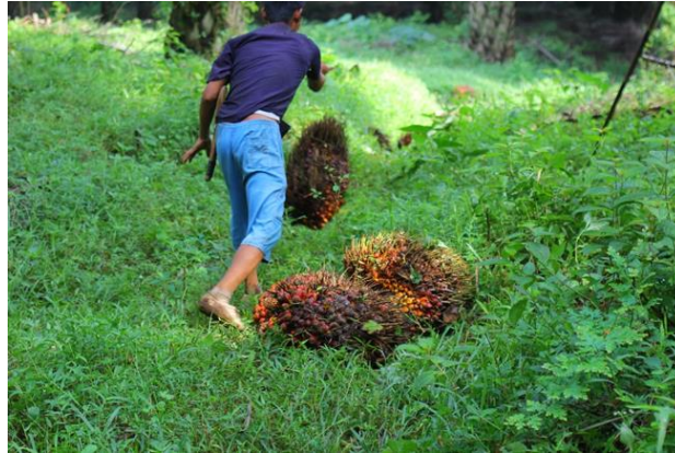
Gambar 3. Proses penggelundungan buah ke TPH

Pada Gambar 3 tersebut terlihat buah yang telah dipanen untuk pengangkutan ke TPH digelundungkan kegiatan seperti ini dapat membuat degradasi massa buah